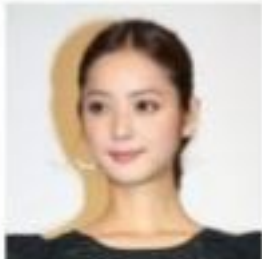
【画像】佐々木希、 ヤンキー時代のプリ