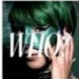
ボートレースCMの緑 色の正体が誰なのか

ブログを訪れたユーザーにできるだけ多くのブログ記事を見ってもらうことで、ユーザーのブログ内滞在時間を伸ばし、ブログ SEO パワーを高め上位表示させることが Wordpress Related Posts を設定する目的です。